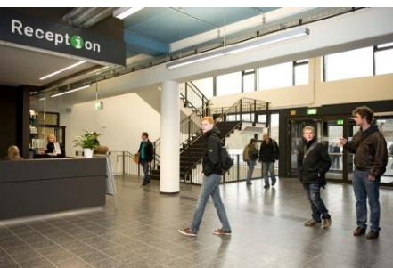
Reception ID auf Ebene 04